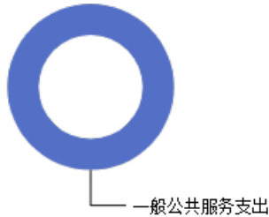
一般公共预算当年拨款结构图

2023年度一般公共预算当年拨款27.10万元,主要用于以下方面:一般公共预算服务支出27.10万元,占100.00%。